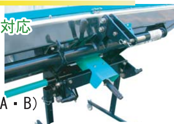
日農工特殊オートヒッチ対応