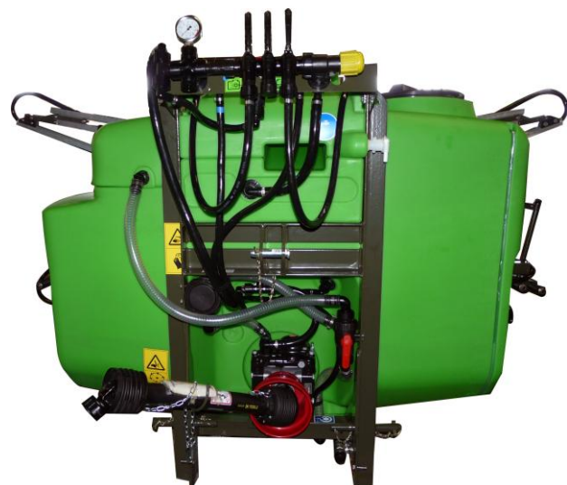
PREMIS800 タンク容量 800L