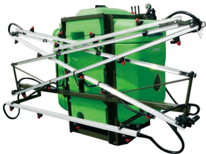
PREMIS600 タンク容量 600L